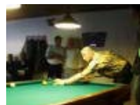
Jean-Marie Vanlandeghem aan het woord euh stoot.