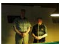
Ook voor de winnaars moest de eigenlijke finale toen nog beginnen,