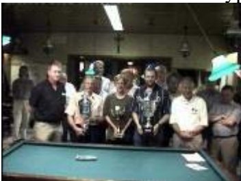
Poseren voor een foto ... voor de lokale krant.