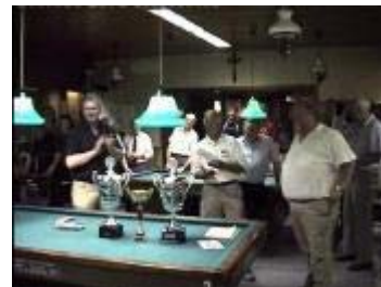
Klaar voor de prijsuitreiking.