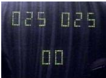
Pffftt ... spannend niet?