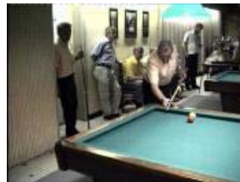
Oef punt gemaakt, weer een stapje dichters.