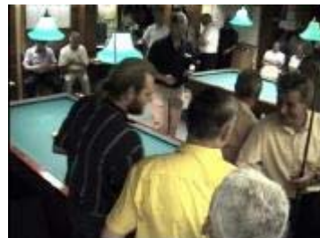
Proficiat aan de winnaars.