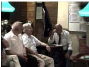
Een moment van bezinning ?