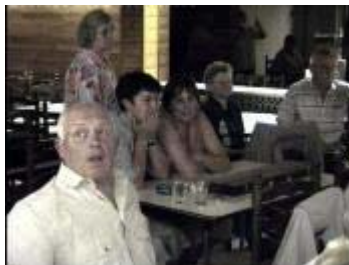
Even Checken hoeveel is't nu?