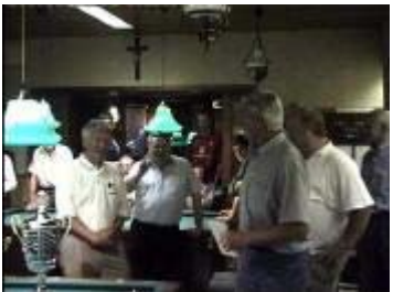
eindwinnaar van het algemeen klassement.