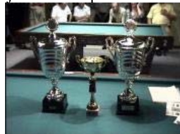
Nog een blik op de bekens.