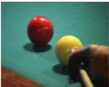
De aanleg ...