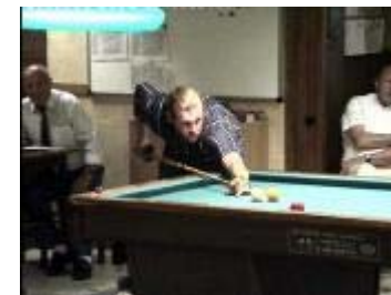
Thuis speler Mostrey aan de beurt.