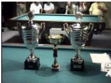
Waar het om te doen was. De eer en ..... de bekers