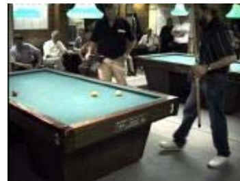
Oef .... één en nog twee zegt de scheidsrechter