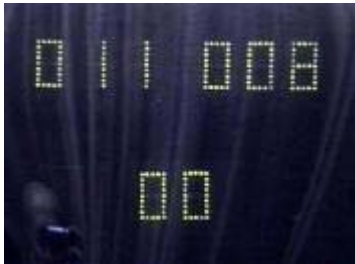
Een gelijk opgaande strijd.