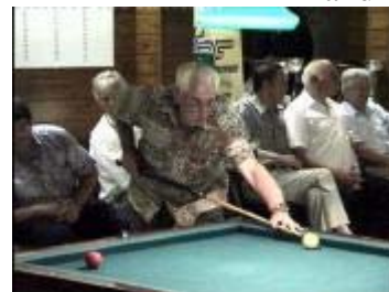
doch helaas .....