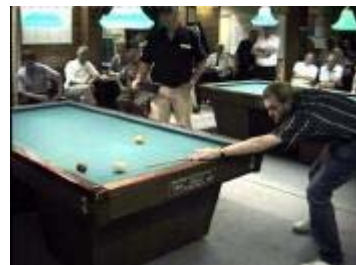
Weg is de bal .....