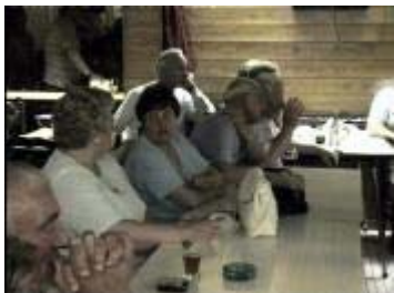
Sommigen volgen .... anderen houden koffieklets.