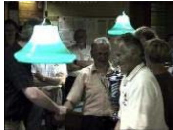
SPP-KAMPIOENEN van 2002-2003