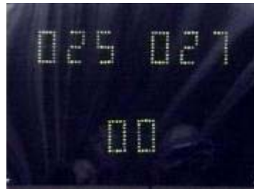
idd ... de zenuwen ....