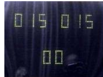
Gelijk ... Het bewijs van een spannende wedstrijd.