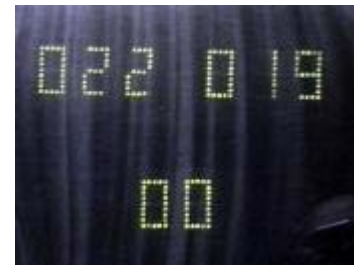
Nog steeds een spannende strijd.