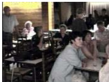
De echtgenotes volgen aandachtig manlief