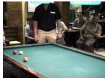
inderdaad ....Twee en LAASTE PUNT horen we ..