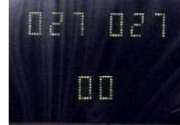
Nog 3 driebanders voor elk. TeTok..Tetok..Tetok De spelers met de harteklop..