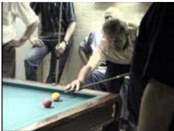
Gevaarlijke bal .....